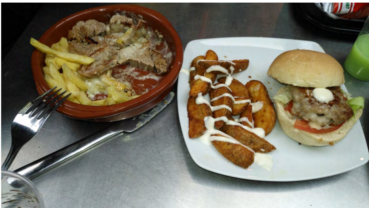
Tapas de “The Food Way”

En esta ocasión, el jurado gastronómico, encargado de dar su veredicto sobre las distintas delicatesses presentadas por los participantes, dio el tercer premio a The Food Way, con su “Garlic,s burger”, el segundo premio fue para la tapa “Majo y mágico”, elaborada por el Centro de ocio “El Casino”, y el primer premio del concurso se lo llevaba en este 2019 Bar Meléndez, con su “Silencioso al ajo manchado”.